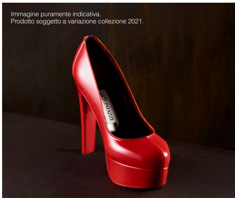
Immagine puramente indicativa. Prodotto soggetto a variazione collezione 2021.