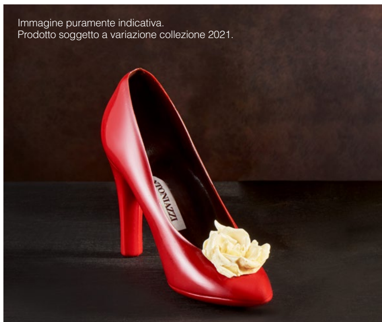
Immagine puramente indicativa. Prodotto soggetto a variazione collezione 2021.