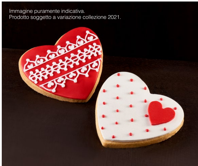
Immagine puramente indicativa. Prodotto soggetto a variazione collezione 2021.