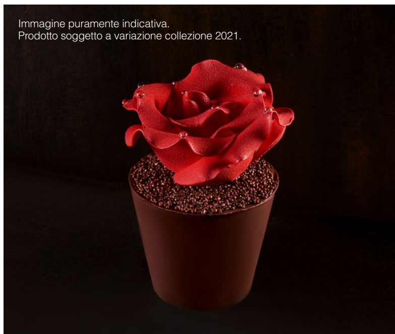
Immagine puramente indicativa. Prodotto soggetto a variazione collezione 2021.