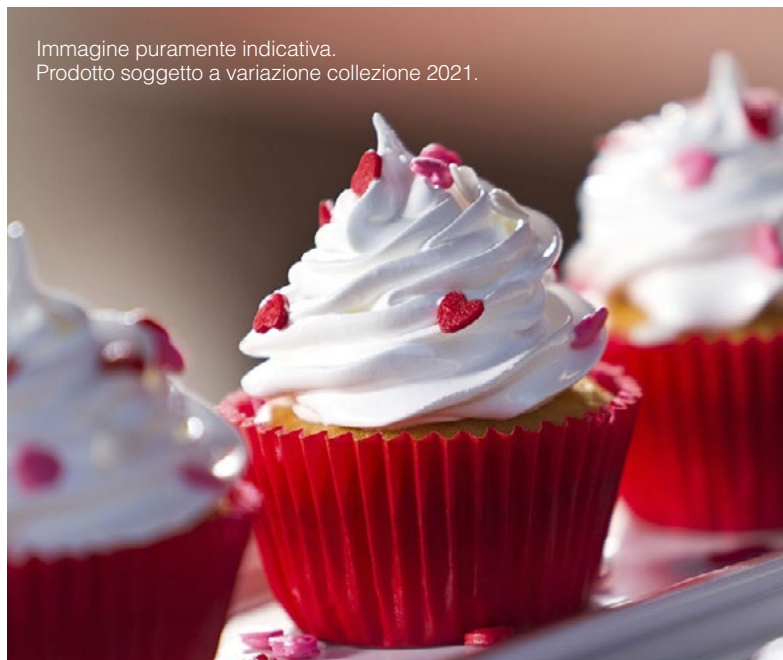
Immagine puramente indicativa. Prodotto soggetto a variazione collezione 2021.