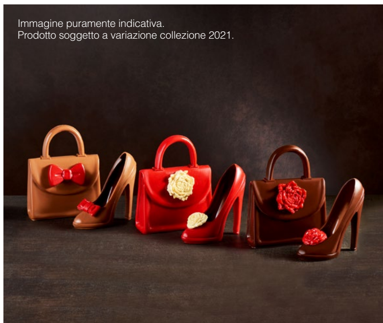
Immagine puramente indicativa. Prodotto soggetto a variazione collezione 2021.