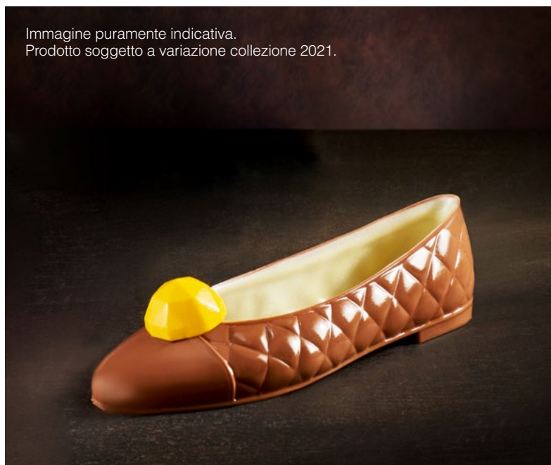
Immagine puramente indicativa. Prodotto soggetto a variazione collezione 2021.