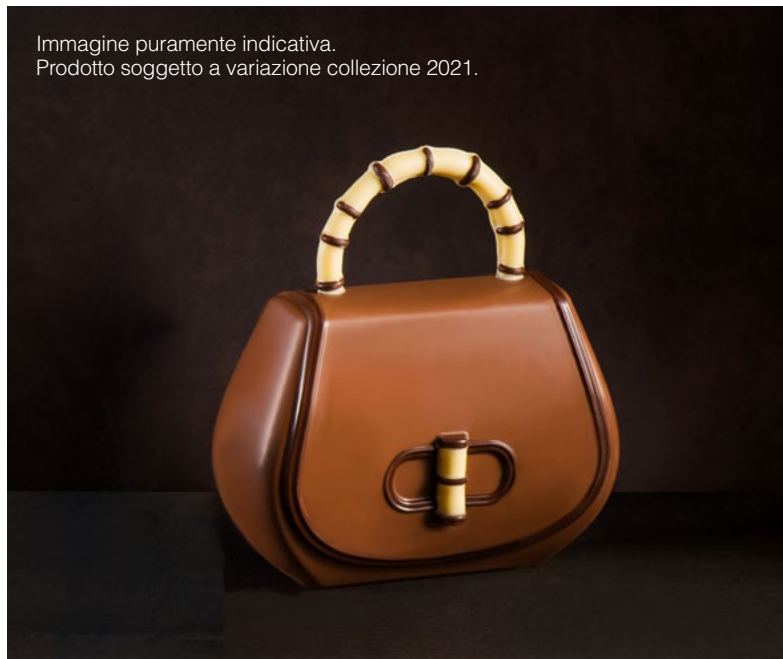
Immagine puramente indicativa. Prodotto soggetto a variazione collezione 2021.