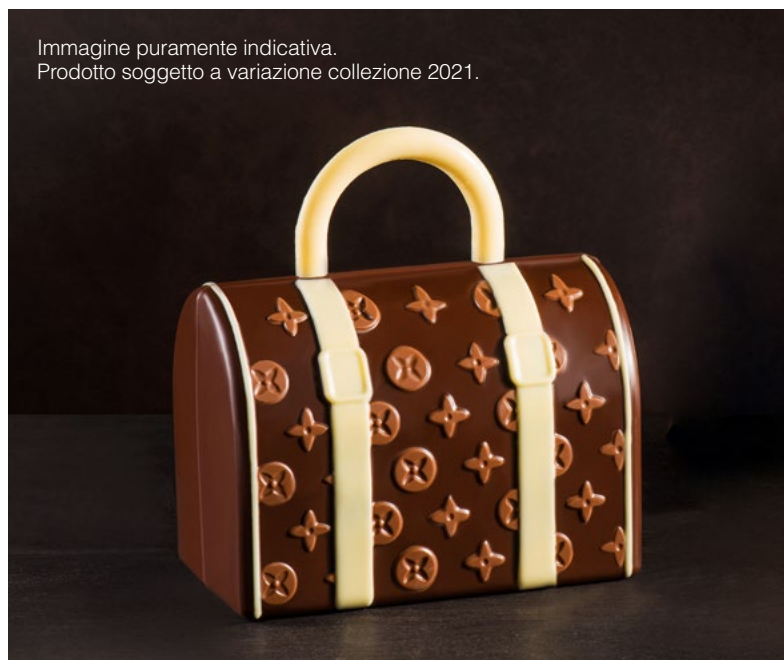
Immagine puramente indicativa. Prodotto soggetto a variazione collezione 2021.